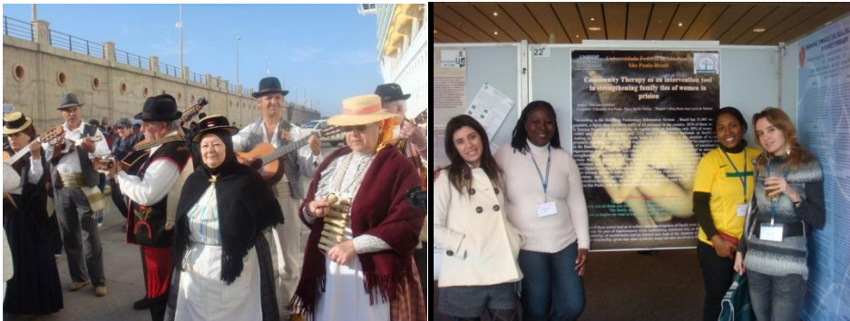
Cuba ,África, Costa Rica