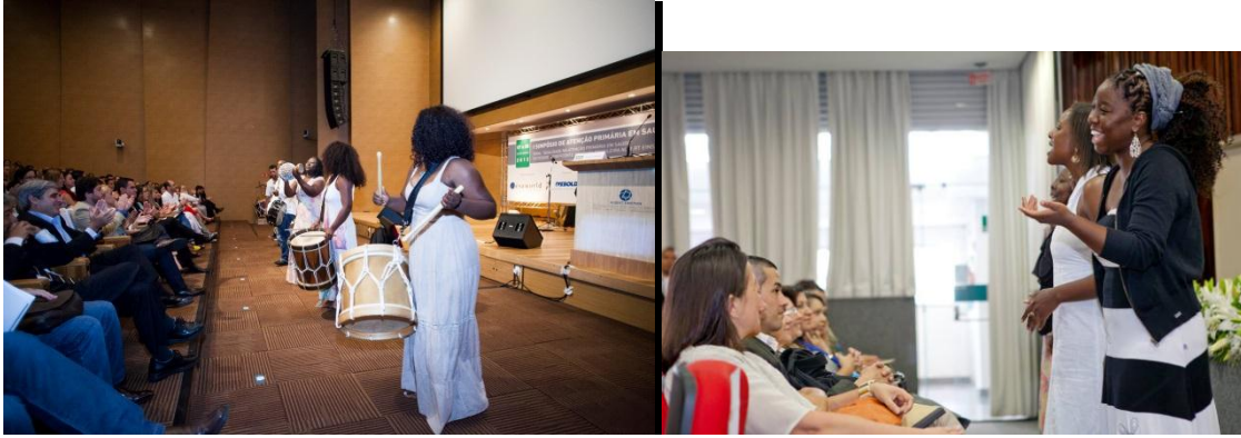
2013 projetos novembro negro com a Cooperifa, concertos didáticos em escolas da zona sul da cidade de São Paulo e realização do curso enlases familiares: