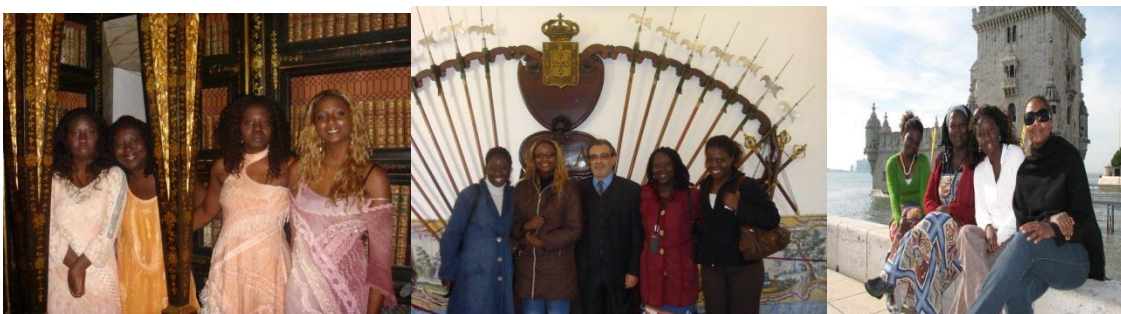
Atuação na área da musicoterapia em parceria com o Instituto Afinando a Vida urso de musicoterapia com Joel .... Canadá :

Segue Link de entrevista cedida ao programa conversão na cidade de Fatima; https://www.youtube.com/watch?v=reWifNScga8