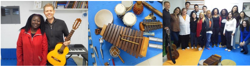
Intercambio cultural na Espanha e apresentação de trabalho sobre musicoterapia na Holanda em 2011