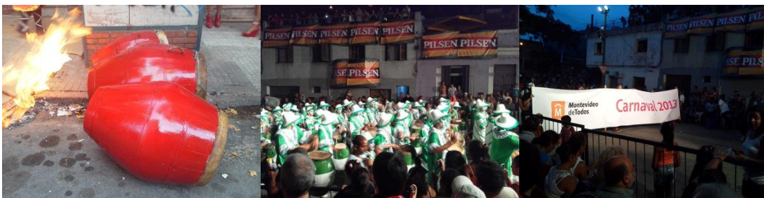
2010 Viagem em turnê artística pelas cidades de Coimbra, Lisboa e Sintra – Portugal

Segue Link de entrevista cedida ao programa conversão na cidade de Fatima; https://www.youtube.com/watch?v=reWifNScga8