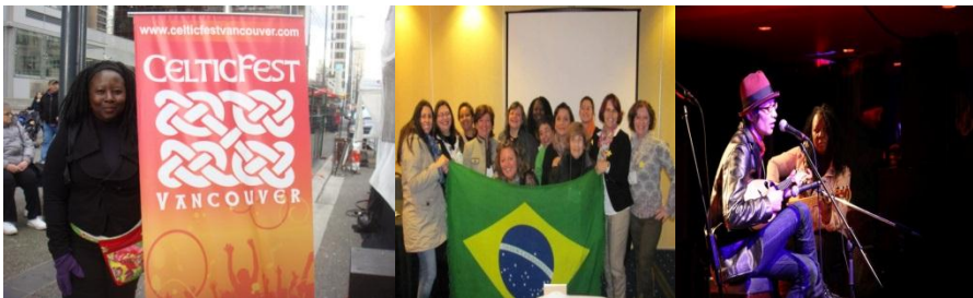
2011 1ª viagem de pesquisa de ritmos afro latinos na cidade de Montevideo Uruguai contato com a instituição mundo afro e com o grupo musical maquina Camdombera