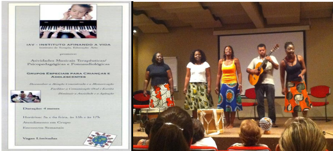
2012 intercambio e pesquisa cultural pelas comunidades indígenas ribeirinhas do rio negro e Solimões – Amazônia