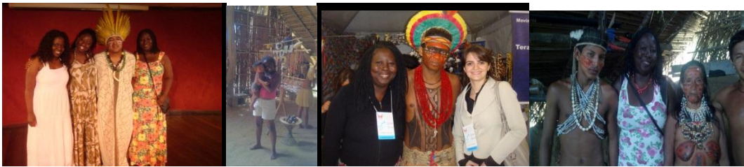
2012 realização de intercambio cultural em Vancouver Canadá: