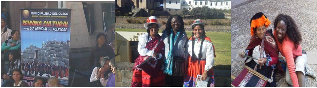
2013 2º viagem e intercambio cultural na cidade de Montevideo Uruguai contato com uma Yamada e intervenção musical com o grupo musical maquina Camdombera